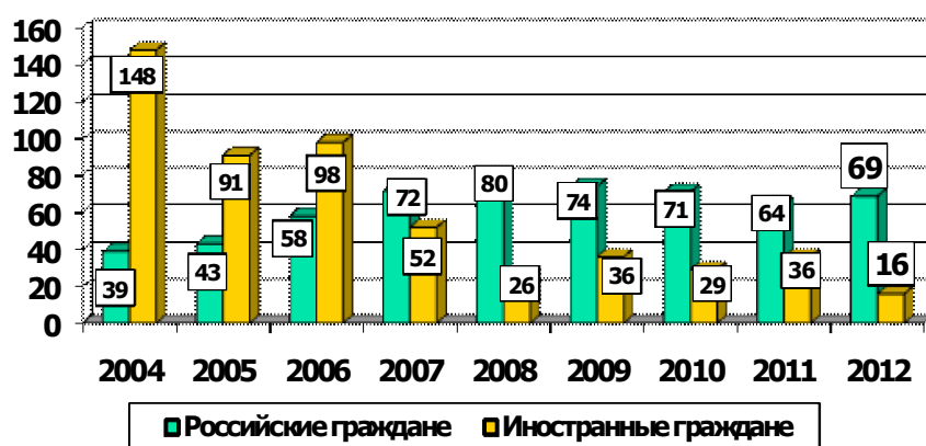
Число детей-сирот и детей, оставшихся без попечения родителей, усыновленных российскими и иностранными гражданами, чел.

Наиболее массовой формой устройства детей в замещающие семьи является опека (попечительство).